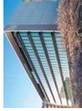
★ Corporativo Tokio (Japón)