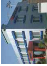
★ Planta Changwon (Korea del Sur) MYCOM KOREA CO., LTD.