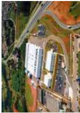
★ Planta Aruja (Brasil) MAYEKAWA DO BRASIL LTDA.