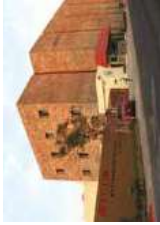
★ Planta Cuernavaca (México) MAYEKAWA DE MEXICO, S.A DE C.V.