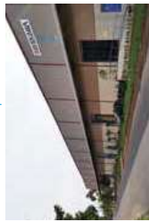
★ Planta Chennai (India) MAYEKAWA INDIA PVT.LTD.