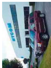
★ Planta Torrance (E.E.U.U.) MAYEKAWA U.S.A., INC.