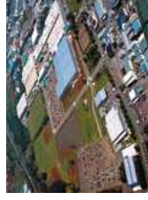
★ Planta Moriya (Japón)