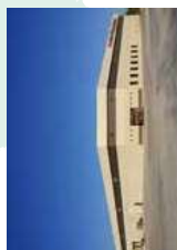
★ Planta Nashville (E.E.U.U.) MAYEKAWA U.S.A., INC.