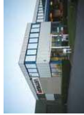
★ Planta Bruselas (Bélgica) N.V. MAYEKAWA EUROPE S.A.